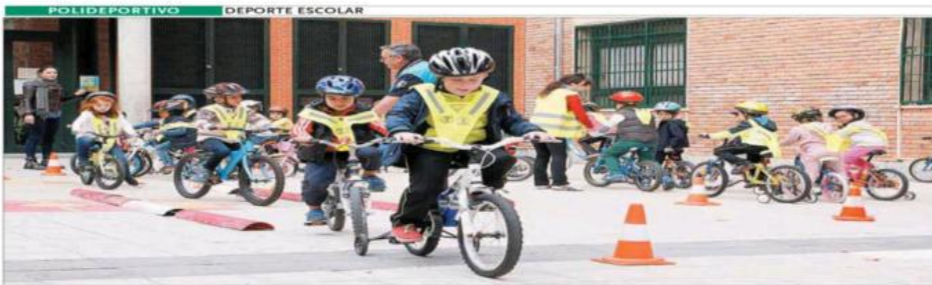
Un grupo de niños, en el patio del colegio Diego de Colmenares aprendiendo a montar en bicicleta.

EL ADELANTADO DE SEGOVIA MIÉRCOLES 20 DE SEPTIEMBRE DE 2017