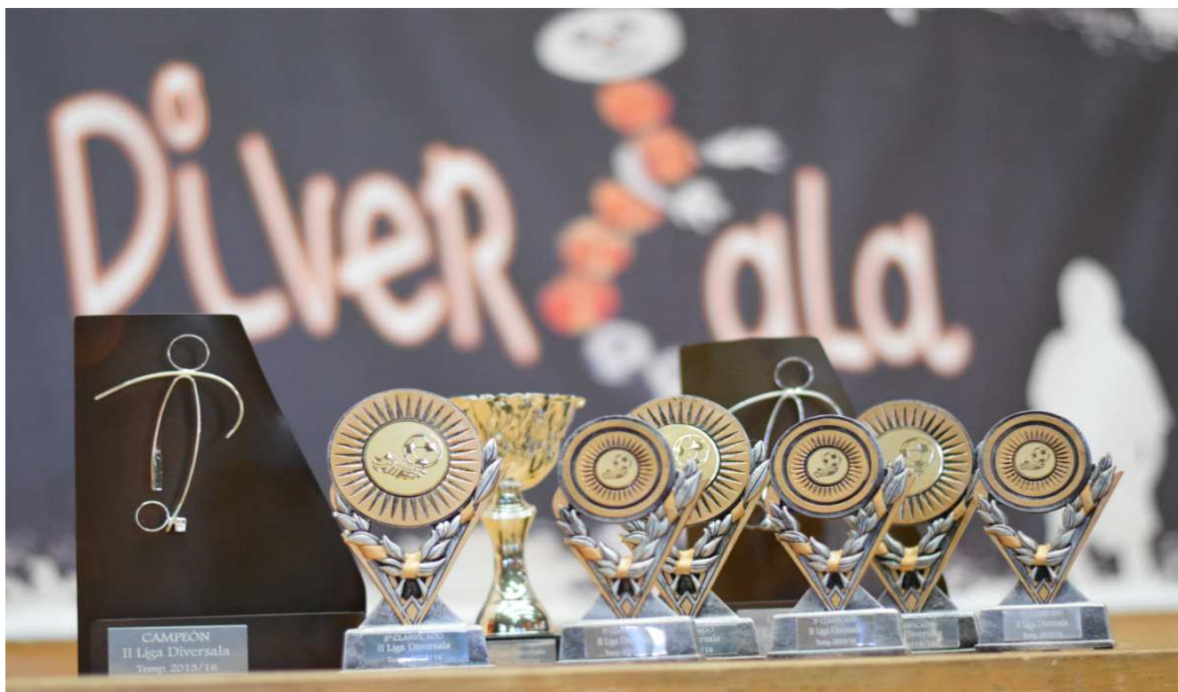
Trofeos de la II Liga Diversala. Temp 15/16