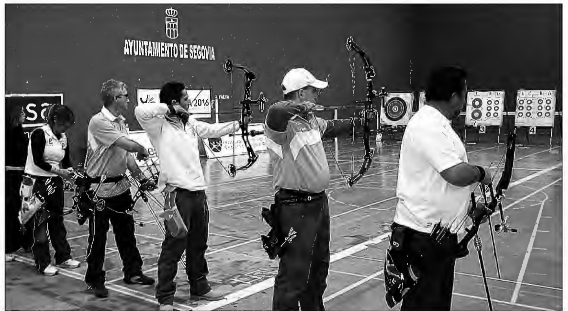
Varios arqueros participando en un torneo en el Frontón Segovia.

La charla tendrá lugar el próximo viernes 18 de noviembre a las 19:30 horas en el aula 2 del Centro Cívico Nueva Segovia, junto al pabellón Pedro Delgado.