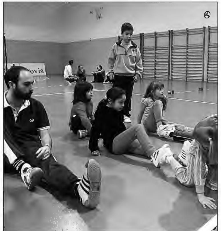
Un monitor de la UVa, junto a varios escolares, durante una actividad.

PROYECTO I+D+i. Además, la Universidad de Valladolid dará continuidad al proyecto I+D+i desarrollado durante el periodo 2008-2010, en el que se llevó a cabo el diagnóstico de la situación del Deporte en Edad Escolar en el municipio de Segovia y el nivel de realización de actividad física regular en la franja de población 7-16 años; así como el desarrollo de un Plan integral de actuación para desarrollar un programa de actividad física regular para la franja de población de 7-12 años en el municipio de Segovia, coordinado