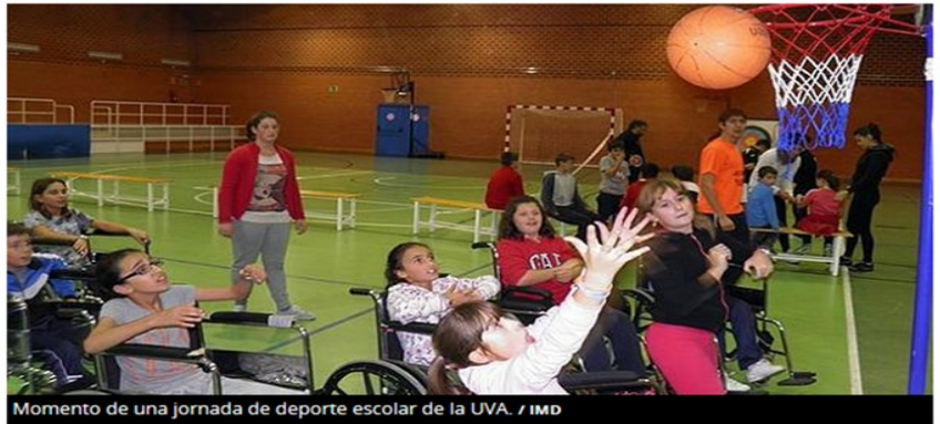
Momento de una jornada de deporte escolar de la UVA.

La institución universitaria cuenta con un programa que llega a 29 centros educativos de la capital