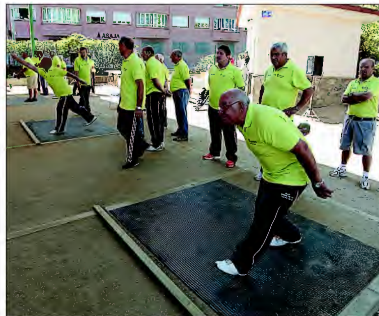
Varios jugadores compiten en la pista 'Orgullo Segoviano'.

Los inscritos en el torneo podrán degustar una paella, y recibirán como obsequio el polo del campeonato. La Fundación Caja Rural se suma a la celebración y organización de esta nueva edición del Torneo IMD 'Ciudad de Segovia'.