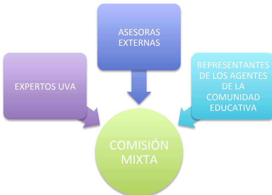
Gráfico 1. Síntesis de los colectivos representados en la Comisión Mixta.

Les niños han trabajado sobre su SUEÑO a través de asambleas, exponiendo sus ideas por escrito, en palabras, planos y/o dibujos, y exponiendo un documento, uno por clase, en el Consejo de Alumnos.