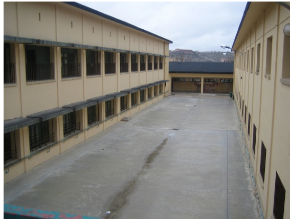
Imágenes 2, 3 y 4: Fotografías de los patios 1, 2 y 3 del centro.

Respecto a las prácticas de uso y distribución del alumnado en los patios 1, 2 y 3 durante el recreo, podemos decir, de manera general que este se produce de manera sincrónica para el todo el alumnado del centro en horario de 11.30 a 12 pm. Esto permite la interacción entre los niños de diversas edades en los "espacios frontera" entre patios.